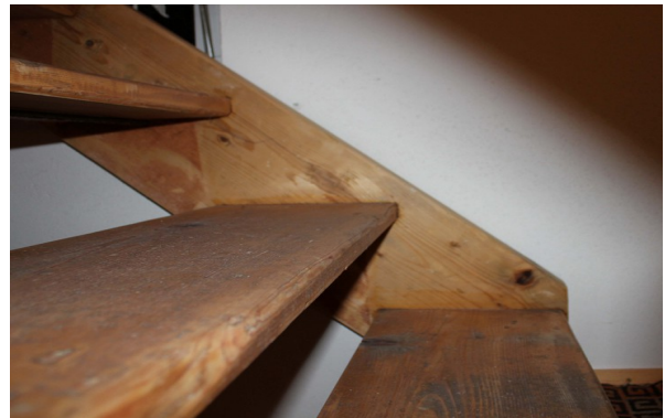
Treppe (mascil-Team Austria)

Eine Treppe setzt sich aus Stufen gleicher Stufenhöhe und gleicher Auftrittsbreite zusammen. Um angenehmes Treppensteigen zu ermöglichen stehen Stufenhöhe, Auftrittsbreite und die menschliche, durchschnittliche Schrittlänge in einem bestimmten Verhältnis zueinander.